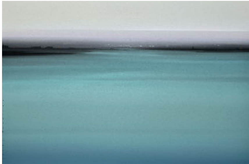
LA CIUDAD DE LA LUZ 40x60 cm, óleo sobre tabla