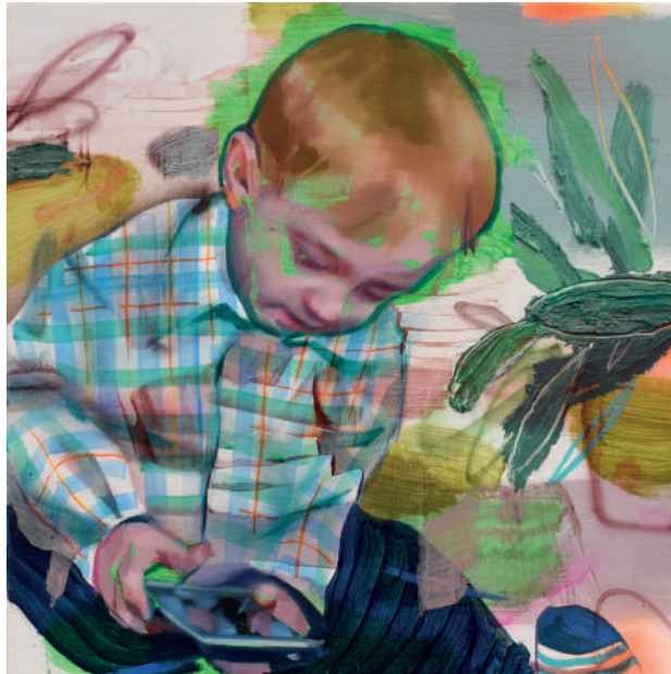
Alienated Óleo sobre lino 30 x 30 cm