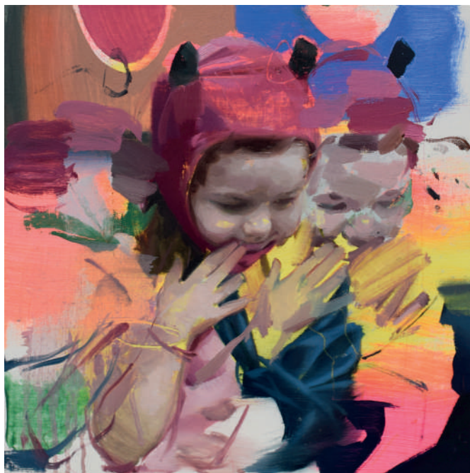
Superheroine Óleo sobre lino 30 x 30 cm