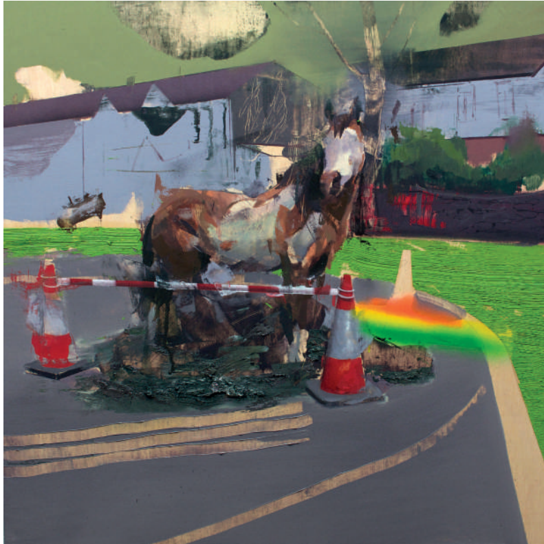
Urban fold óleo sobre tabla 80 x 80 cm