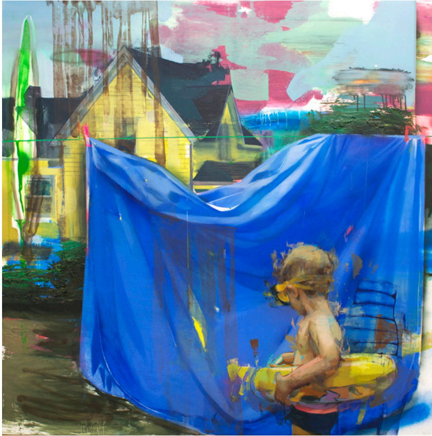
Salvavidas , 100x100 cm, óleo sobre lino