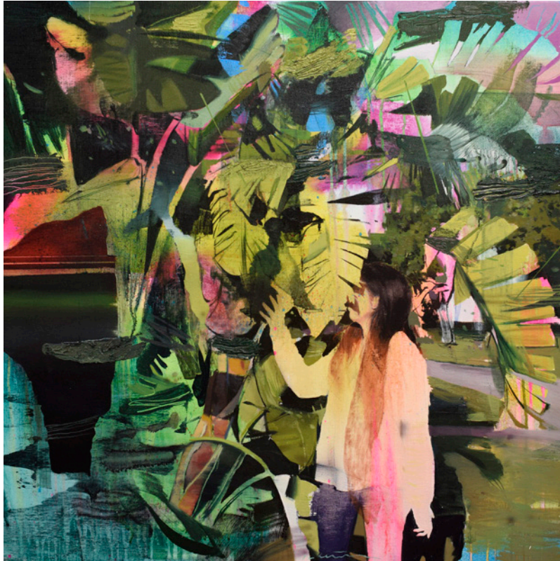
Manto de color, 80x80 cm, óleo sobre lino