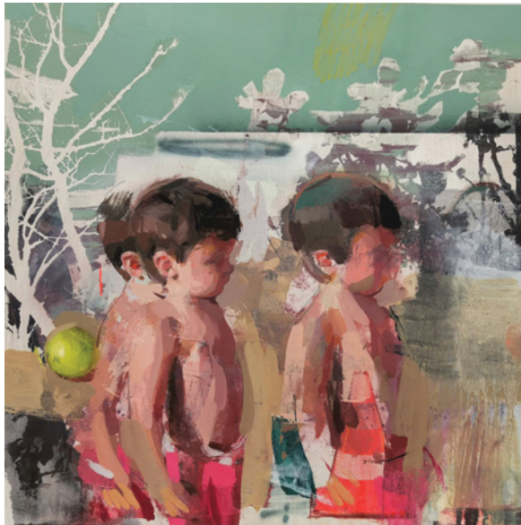
Encuentros fortuitos, 40x40 cm, óleo sobre tabla