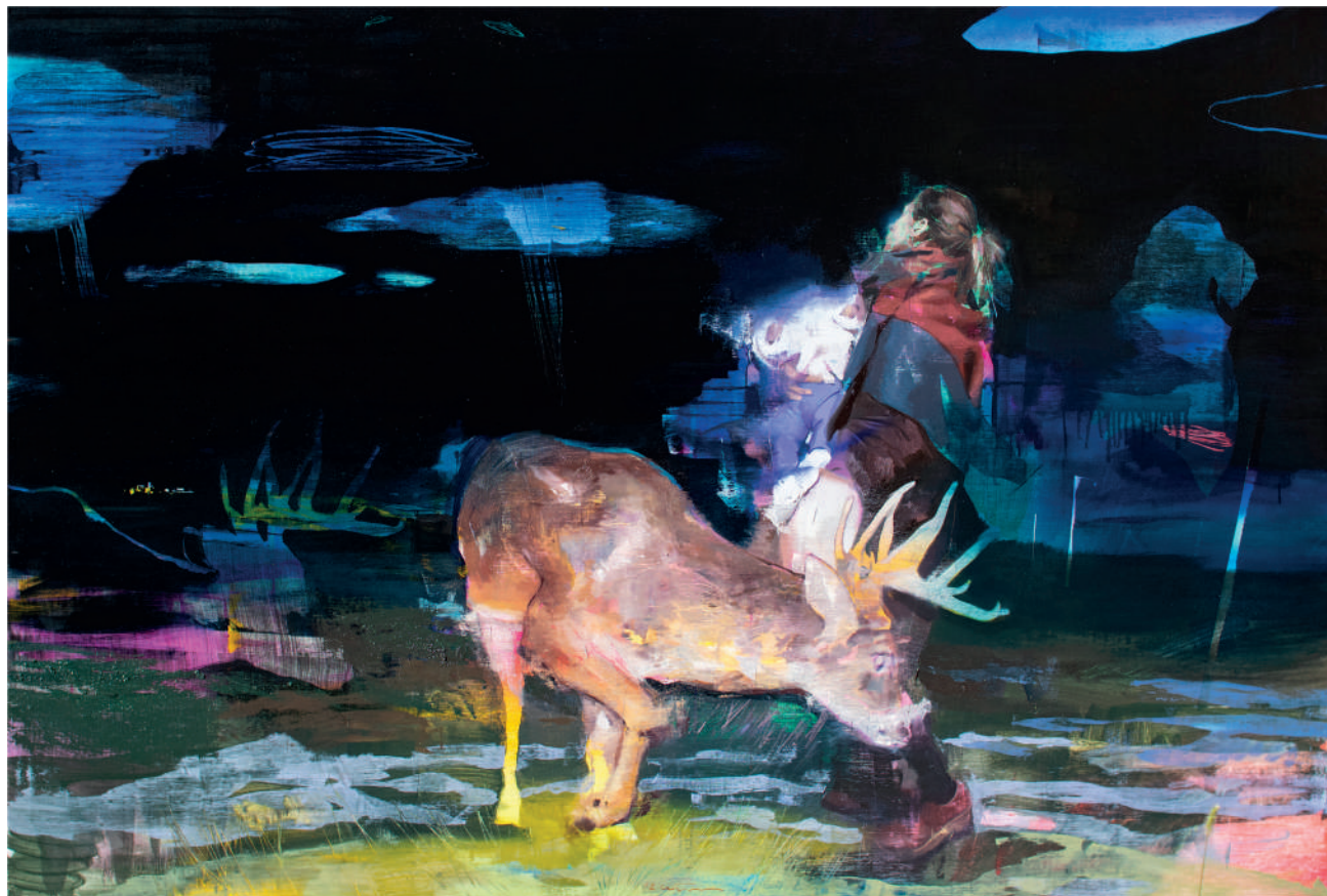
Ufo sighting Óleo sobre lino 120 x 180 cm