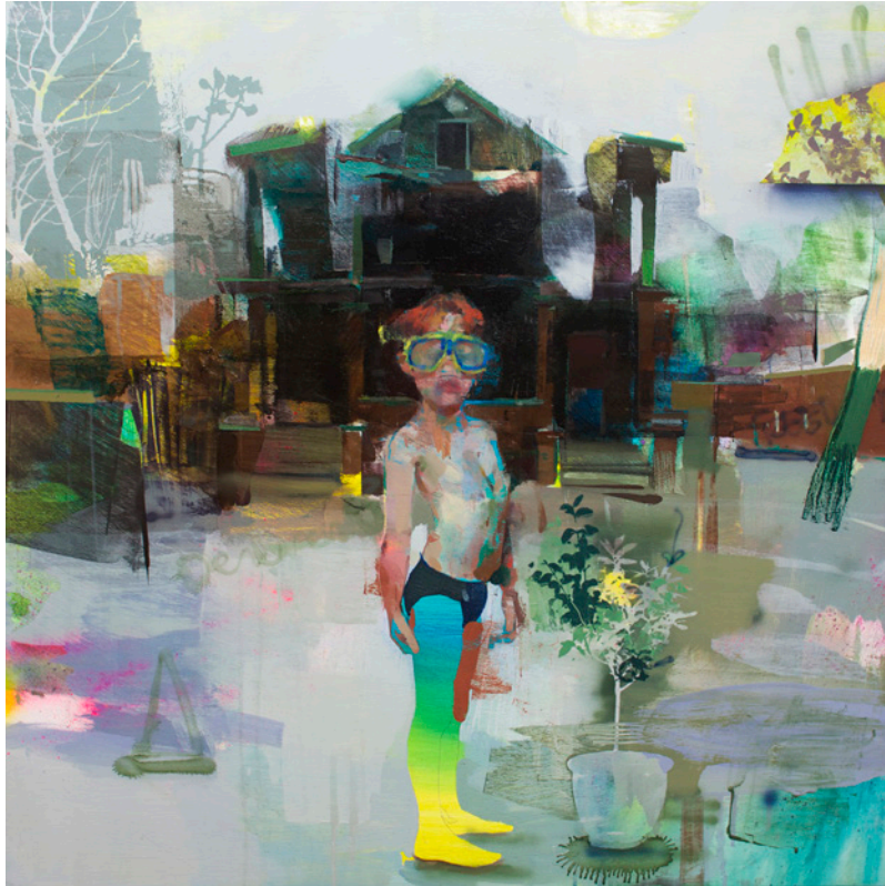
Botes verdes , 80x80 cm, óleo sobre tabla