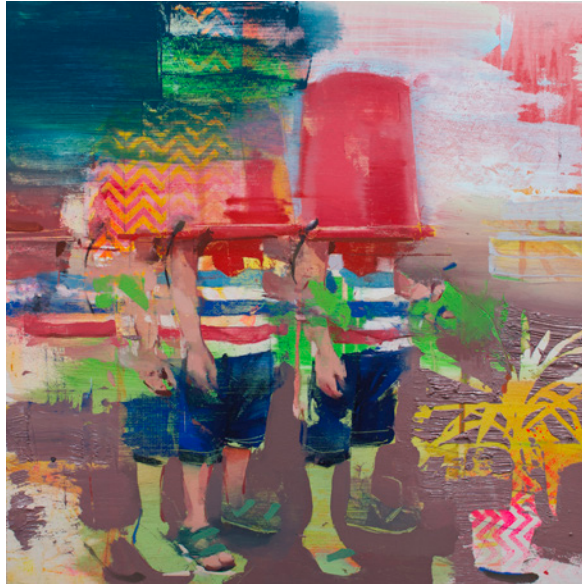
Pistolas de clorofila, 40x40 cm, óleo sobre tabla