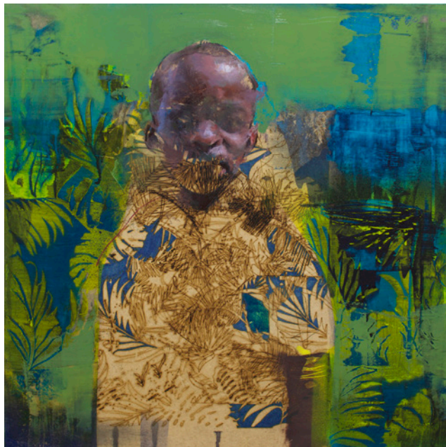
Invisible , 50x50 cm, óleo y pirograbado sobre tabla