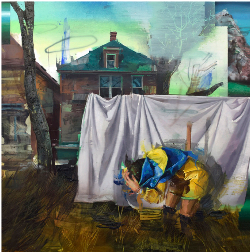
Al otro lado , 100x100 cm, óleo sobre lino