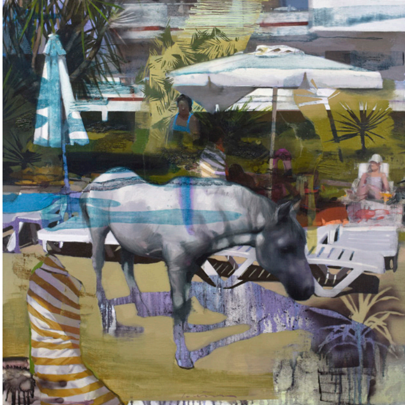
Vía libre , 80x80 cm, óleo sobre lino