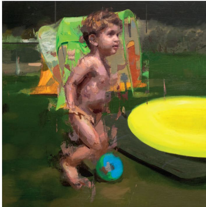
Enjoying pepa Óleo sobre tabla 50 x 50 cm