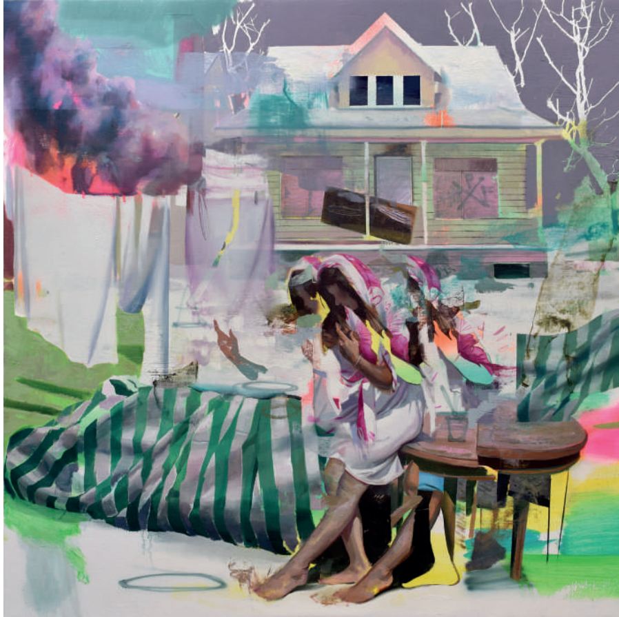
Entretelas Óleo sobre lino 100 x 100 cm