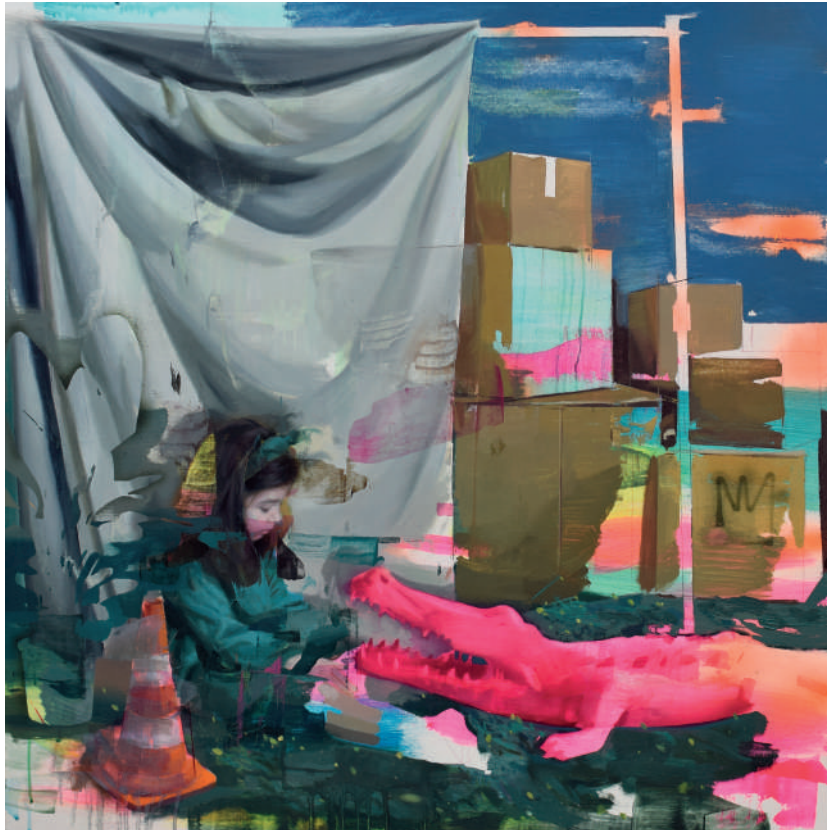
Encounters Óleo sobre lino 80 x 80 cm