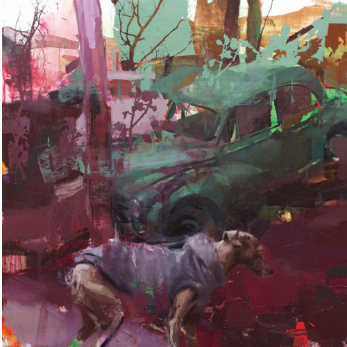
Tiempos extraños , 60x60 cm, óleo sobre lino