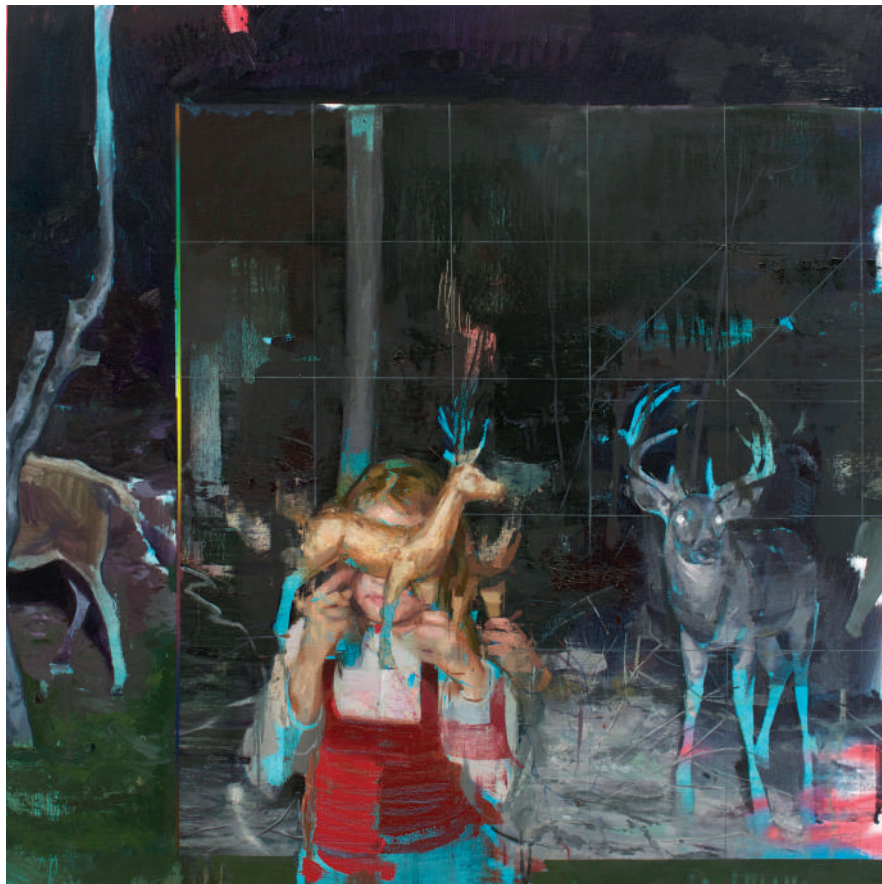
Deer's dream Óleo sobre lino 100 x 100 cm