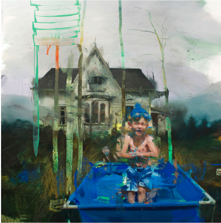
Último día de verano, 100x100 cm, óleo sobre lino