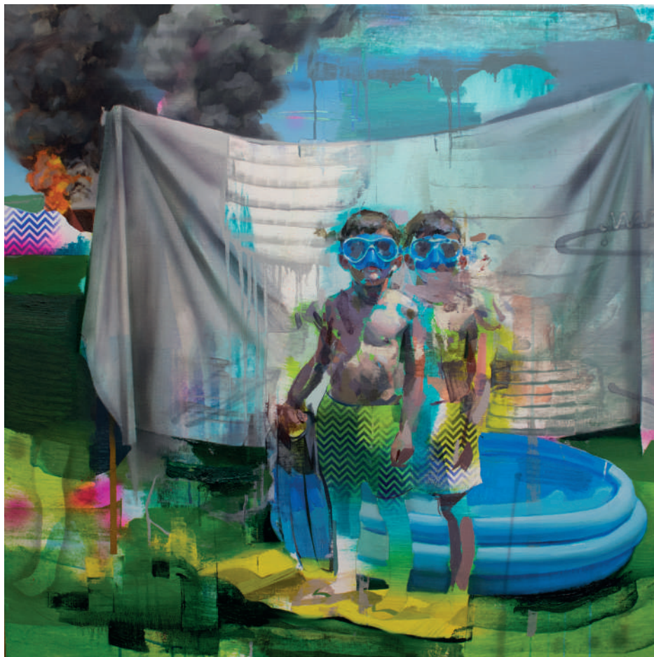
Meanwhile behind Óleo sobre lino 120 x 120 cm