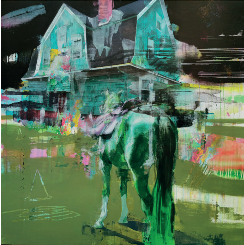
Nowhere Óleo sobre lino 120 x 120 cm