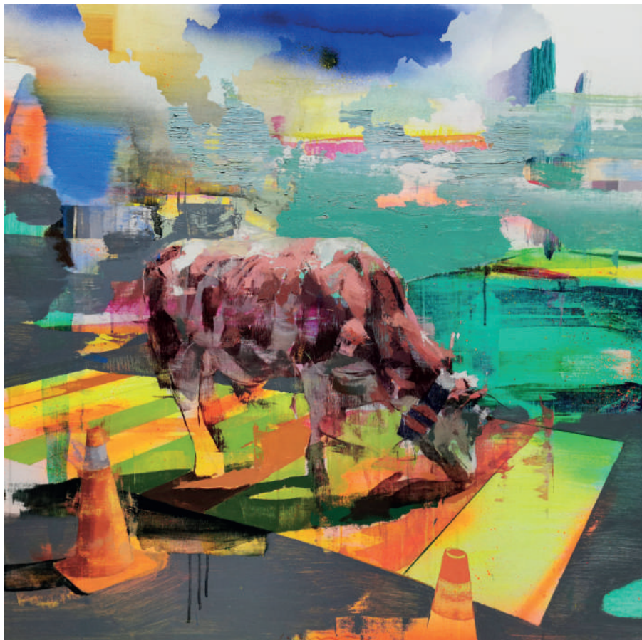
Urban fold III óleo sobre lino 100 x 100 cm