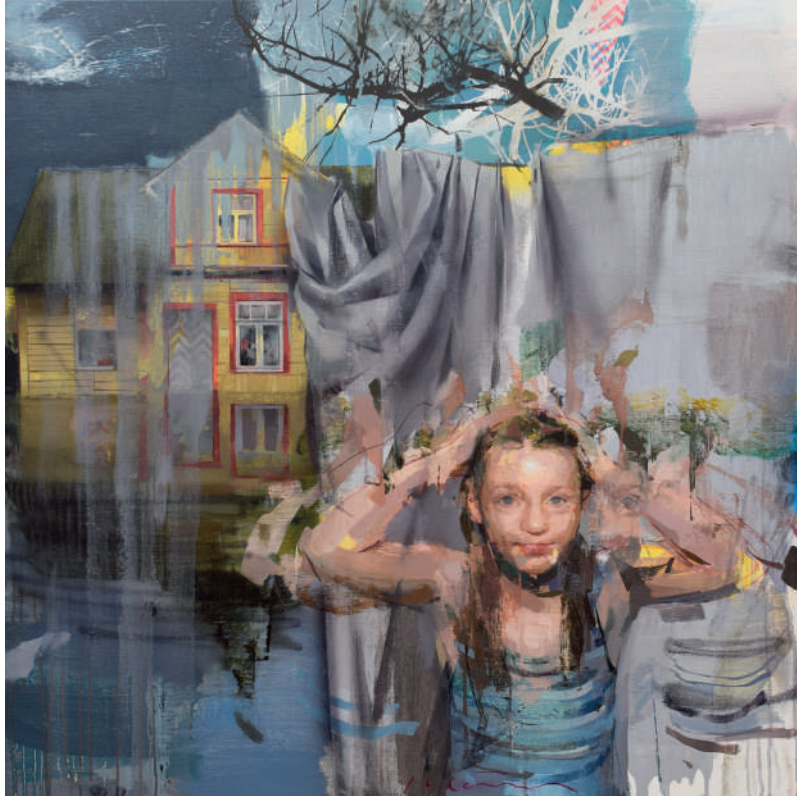
Behind the scene Óleo sobre lino 80 x 80 cm