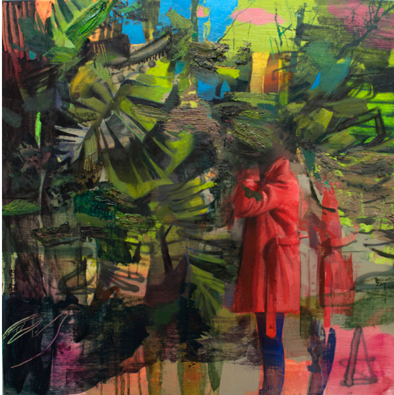
Manto de color II , 80x80 cm, óleo sobre lino