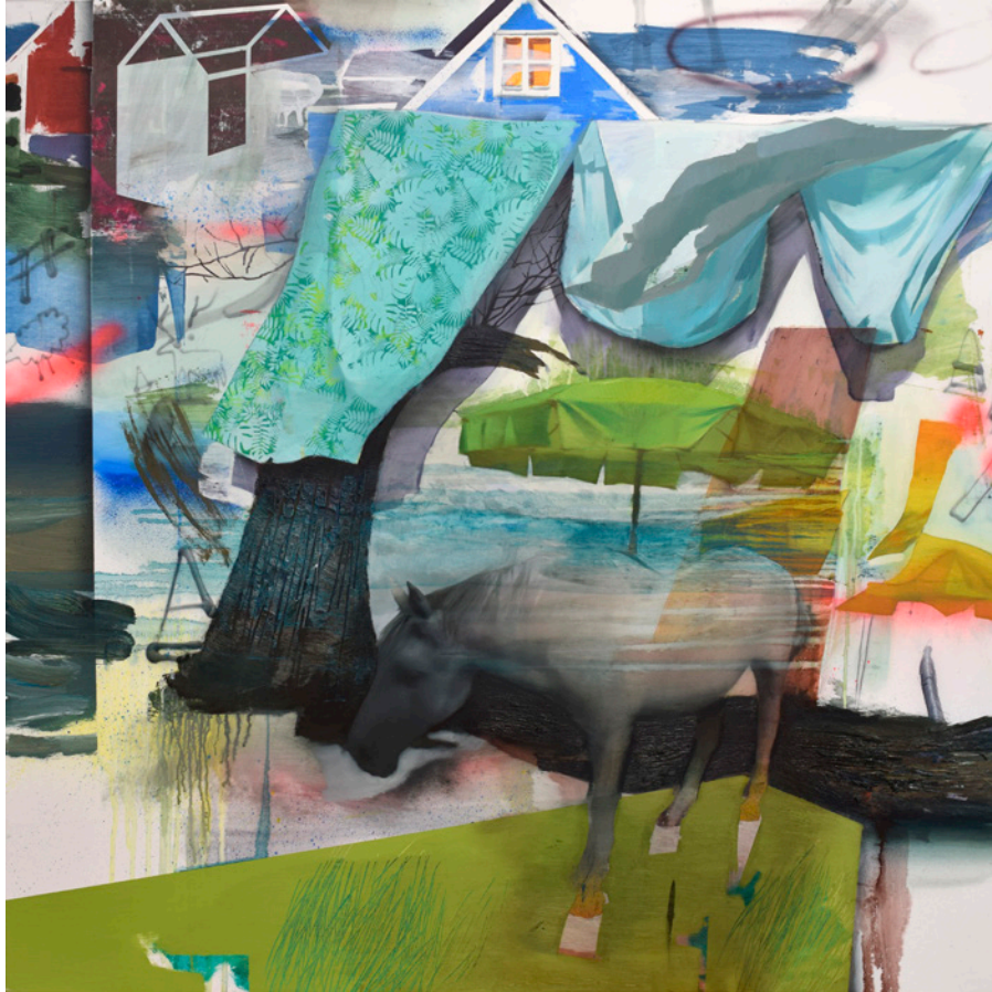
El tendal , 120x120 cm, óleo sobre lino (INACABADO)