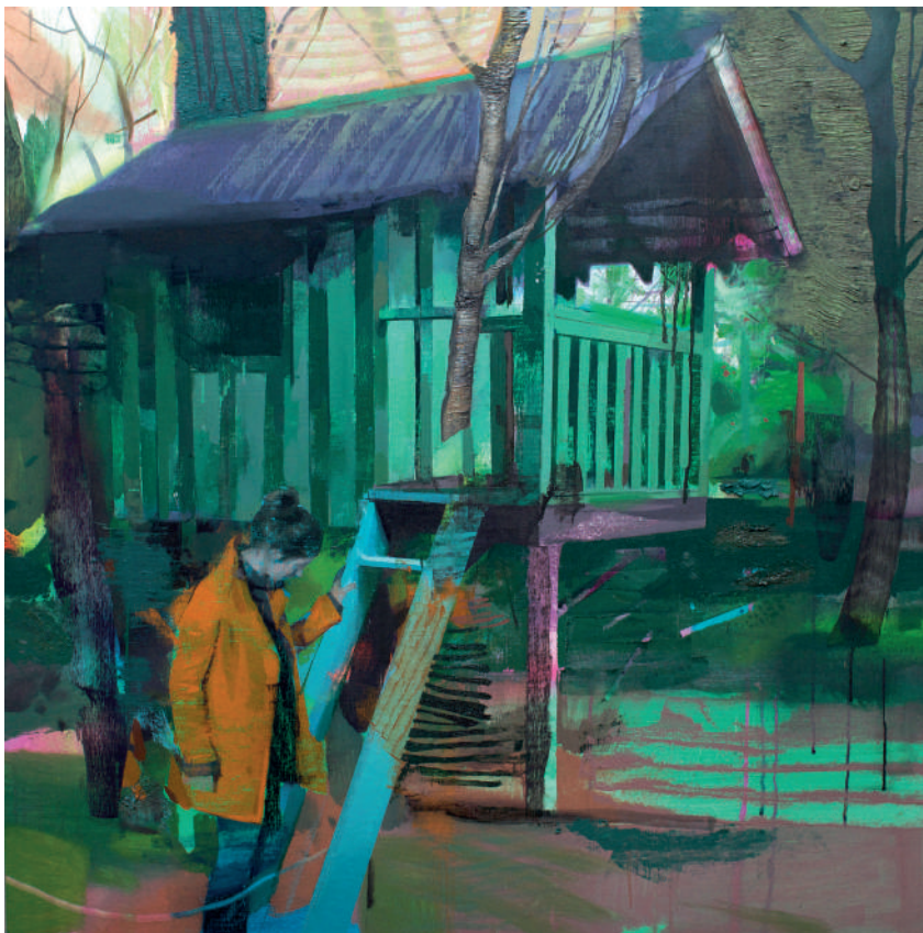
The last step Óleo sobre lino 100 x 100 cm