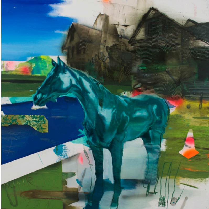
El pozo de los deseos 2, 80x80 cm, óleo sobre lino