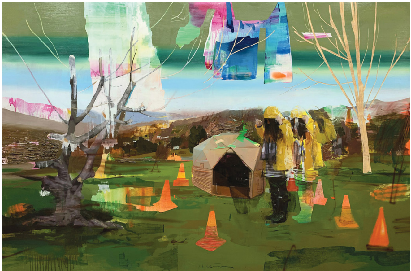
Casa de campo , 180x120cm, óleo y tallado sobre tabla