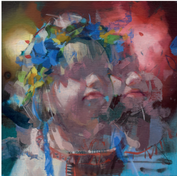
Fireworks Óleo sobre lino 30 x 30 cm