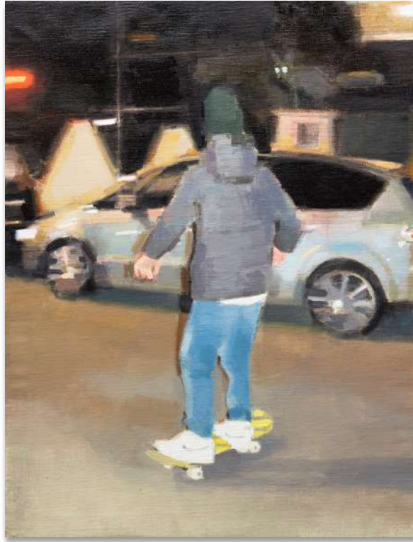
Animales nocturnos (Animales nueches)