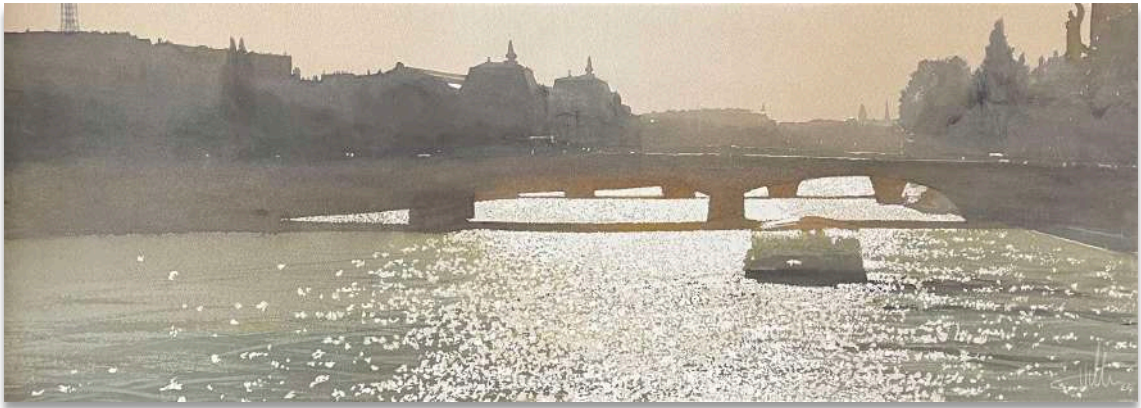
París puente del Carrousel