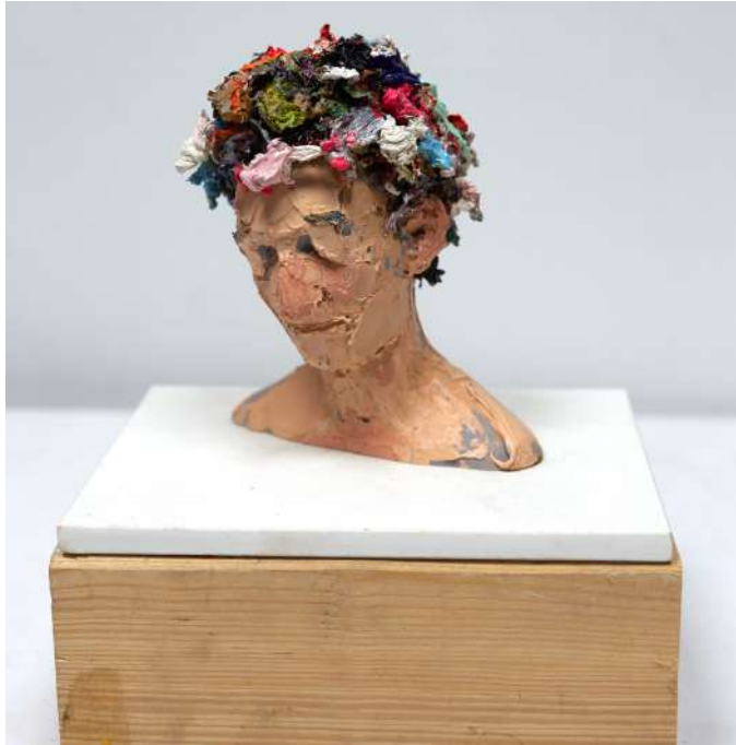
La segunda vida de todos ellos ( La segunda vida de toos ellos )