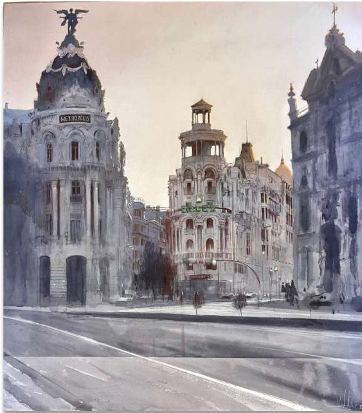
Madrid Alcalá Gran Vía